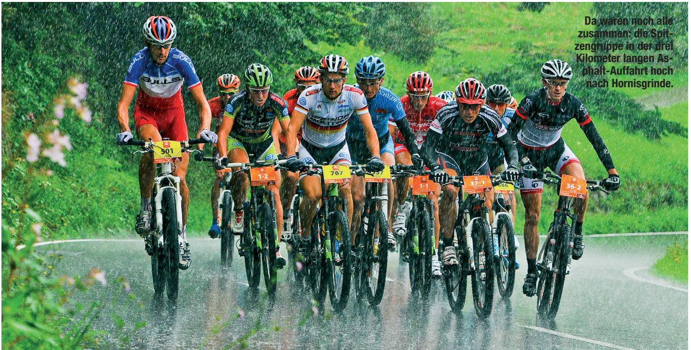
Da waren noch alle zusammen: die Spitzengruppe in der drei Kilometer langen Asphalt-Auffahrt hoch nach Hornisgrinde.